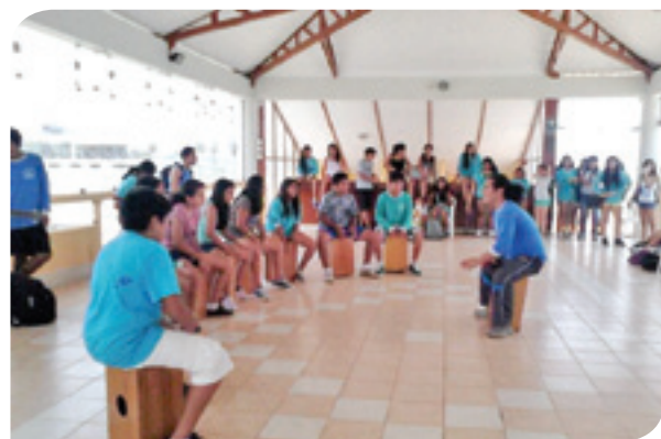
Alumnos en talleres de guitarra y cajon