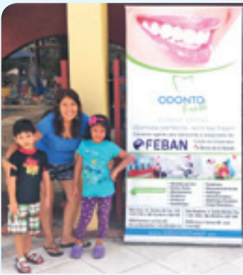
Despistaje odontológico gratuito para los afiliados del FEBAN y familiares

Odontofresh es una clínica dental con más de 14 años de experiencia en el cuidado de la salud bucal, con dos sedes, ubicadas en: la Avenida Caminos del Inca 1138 - Santiago de Surco y en el Jirón Castilla 806 - 2° piso, Magdalena del Mar.