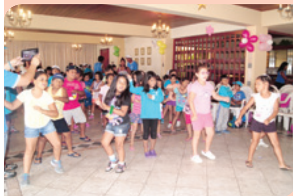
Alumnos de Vacaciones recreativas disfrutando de actividades por el día de la amistad