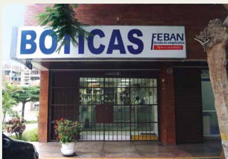
Botica La Calera

Dirección: Calle Alfa Águila 108 Urb. La Calera de la Merced - Surquillo. Teléfono: 273-2354