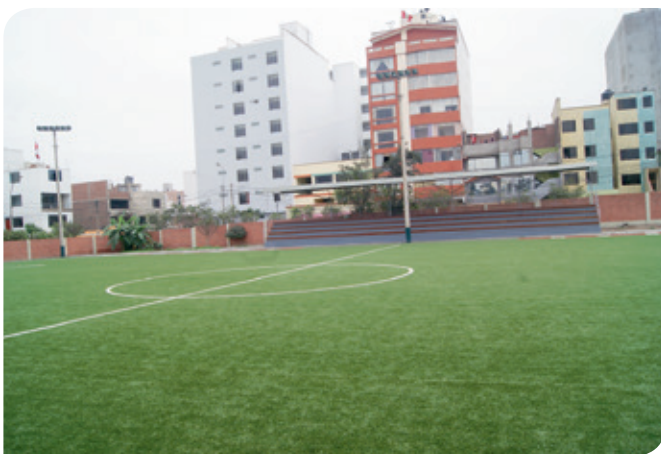
Nuevo grass de alta calidad con certificación FIFA de procedencia Holandesa

La escuela de fútbol de menores del FEBAN, desarrolla sus actividades en el complejo deportivo, ubicado en la calle Engels N° 123 - 125, Urb. La Calera de la Merced, Surquillo. ■