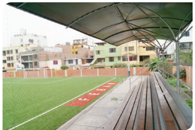
Mantenimiento y pintado de la tribuna y demás instalaciones