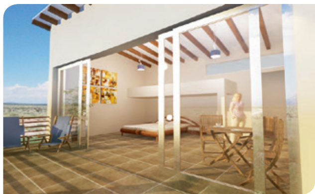
Vista interior de las habitaciones