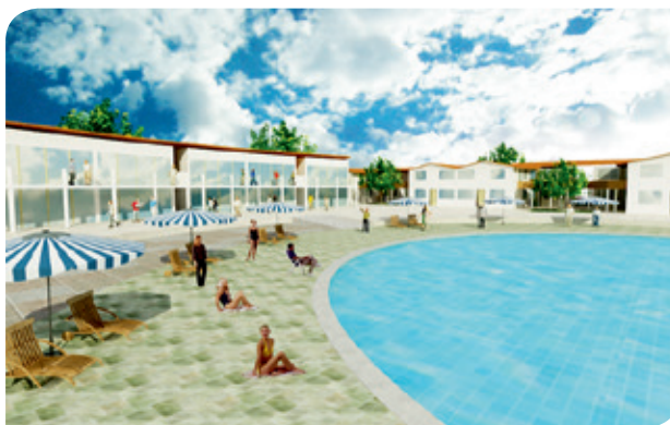
Vista frontal del resort, bungalows y piscina